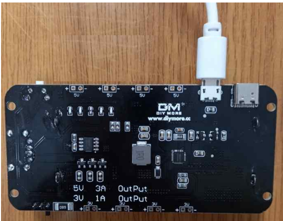
(Micro USB 충전단자로 충전)