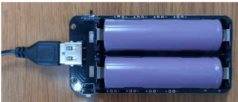
(USB Type-A 케이블로 다른 제품에 전원을 공급하고 있는 모양)