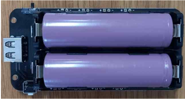
(18650 Size 리튬 배터리가 장착된 모양)