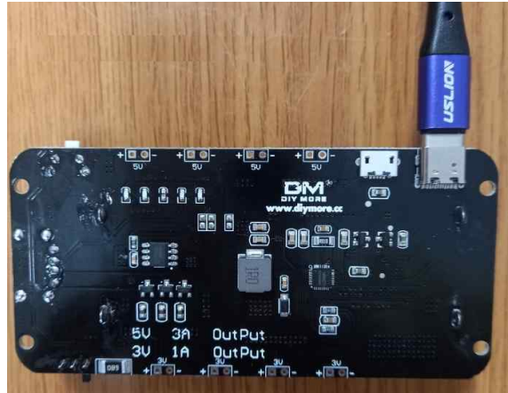
(Type-C USB 충전단자로 충전)