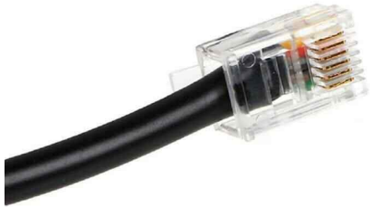
[ 6 핀 모듈러 플러그 구성 ]